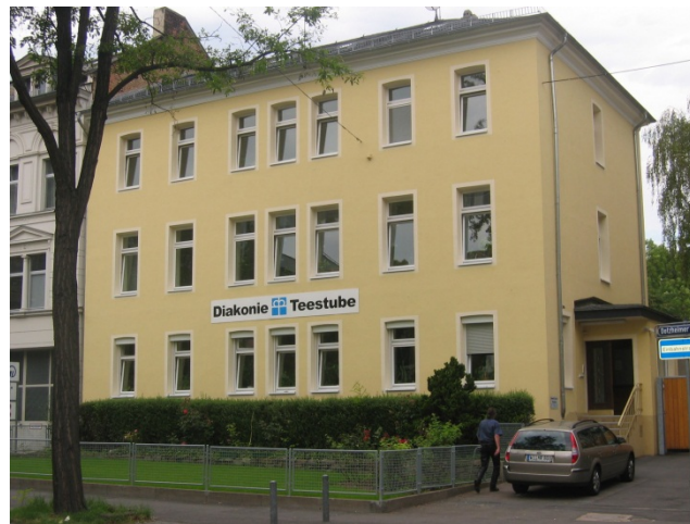
Diakonie Wiesbaden Teestube

Fachberatung und Tagesaufenthalt für wohnungslose und sozial ausgegrenzte Menschen